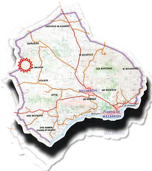
Mapa de situación de la ruta en el municipio y la vía de acceso y comunicación.

Relieves accidentados, precipitaciones irregulares y de cuantía inferior a los 250 mm anuales, temperaturas medias de 17-18 °C, vegetación escasa y de bajo porte,.... datos todos ellos que tomados individualmente no sirven para explicar las sensaciones que asaltan al viajero que se acerca a estas tierras. Sensaciones que quizá habría que definir como contradictorias, porque Mazarrón más allá de los datos cuantificables ofrece una imagen compleja construida por, el mar, la sierra y los campos, el pasado minero y el presente agrícola y turístico, una imagen de dureza, de lucha por la supervivencia y de fertilidad, una imagen contradictoria entre lo natural y lo artificial. Por ello Mazarrón necesita ser caminado para ser conocido, y a ello quieren modestamente contribuir las presentes guías.