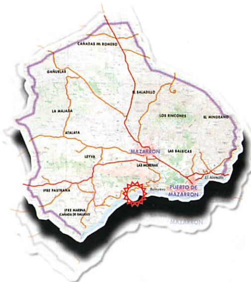
Mapa de situación de la ruta en el municipio y la vía de acceso y comunicación.

A CAMINANTES, SENDERISTAS Y VIAJEROS EN TIERRAS DE MAZARRÓN. Relieves accidentados, precipitaciones irregulares y de cuantía inferior a los 250 mm anuales, temperaturas medias de 17-18°C, vegetación escasa y de bajo porte,... datos todos ellos que tomados individualmente no sirven para explicar las sensaciones que asaltan al viajero que se acerca a estas tierras. Sensaciones que quizá habría que definir como contradictorias, porque Mazarrón más allá de los datos cuantificables ofrece una imagen compleja construida por, el mar, la sierra y los campos, el pasado minero y el presente agrícola y turístico, una imagen de dureza, de lucha por la supervivencia y de fertilidad, una imagen contradictoria entre lo natural y lo artificial. Por ello Mazarrón necesita ser caminado para ser conocido, y a ello quieren modestamente contribuir las presentes guías.