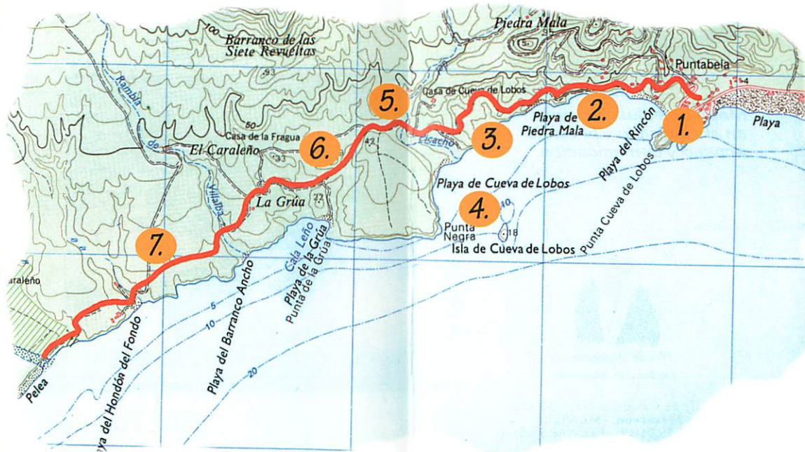
Reducido un 10% de la Escala 1:25.000